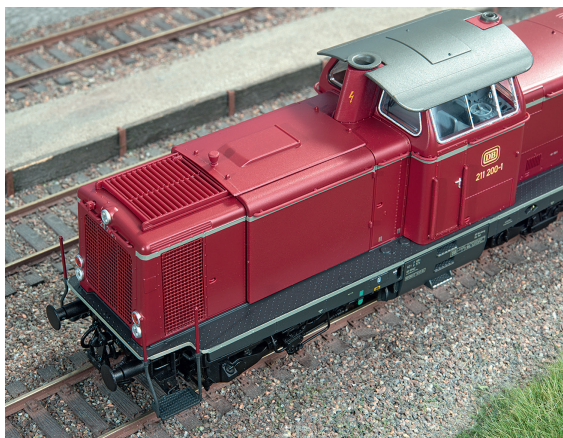
Auch von oben überzeugt der Anblick.

N och eine V100 für H0? Ja, diesmal eine aus Sonneberg. Auch Piko bietet nun eine Miniatur dieser Allerwelts-Nebenbahn-Diesellok der Deutschen Bundesbahn im Maßstab 1:87 an. In Anbetracht der Vielzahl an gelungenen, neu oder gebraucht erhältlichen Mitbewerbermodellen lohnt es sich, einmal ganz genau hinzusehen, was denn nun die Thüringer Neukonstruktion an Pluspunkten für sich verbuchen kann.