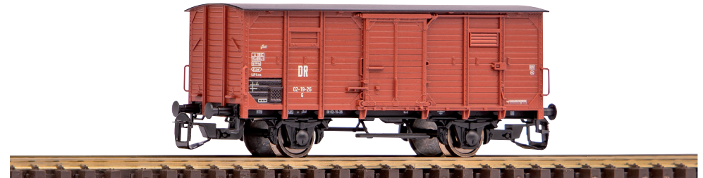
47761 Gedeckter Güterwagen G02 DR Ep. III, ohne Bremserhaus