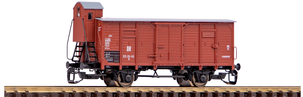
47760 Gedeckter Güterwagen G02 DR Ep. III, mit Bremserhaus

Die erstmals von der preußischen Staatsbahn beschafften Wagen waren auch für die Deutsche Reichsbahn lange Zeit ein häufig anzutreffender Zeitgenosse. Entsprechend groß dürfte die Freude der Anhänger des Maßstabes 1:120 ausfallen, dass diese neu konstruierten Güterwagen nun auch in dieser Spurgröße verfügbar sind. Die Optik überzeugt wie für PIKO üblich mit feinsten Gravuren. Hierdurch lassen sich die einzelnen Planken der in Verbandsbauart gefertigten Fahrzeuge genau erkennen. Gleiches schlägt sich bei den Drehgestellen nieder, von den Federpaketen bis zu den Bremsbacken sind alle Einzelteile gut erkennbar umgesetzt worden. Für maximalen Spielspaß sind die Wagen ab Werk bereits vollständig montiert und aufgerüstet. Viele Anbauteile sind separat und freistehend angesetzt. Die saubere Verarbeitung führt nicht nur zu einem prächtigen Anblick in den Vitrinen von Sammlern, sondern auch zu einem besonders hohen Fahrvergnügen. Detailliert und dennoch robust rollen die Güterwagen über die verschiedensten Gleisanlagen.