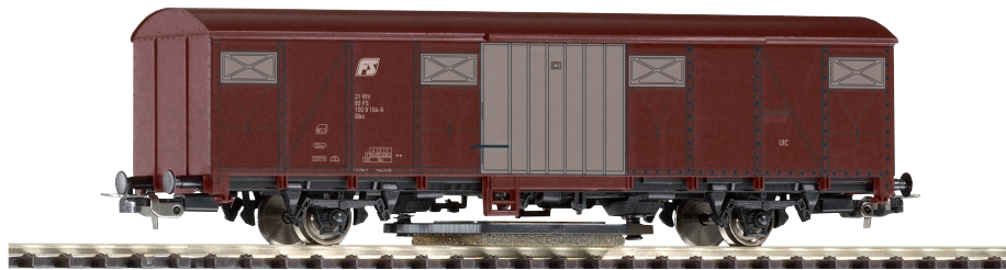
58919 Schienenreinigungswagen Gbs FS Ep. IV