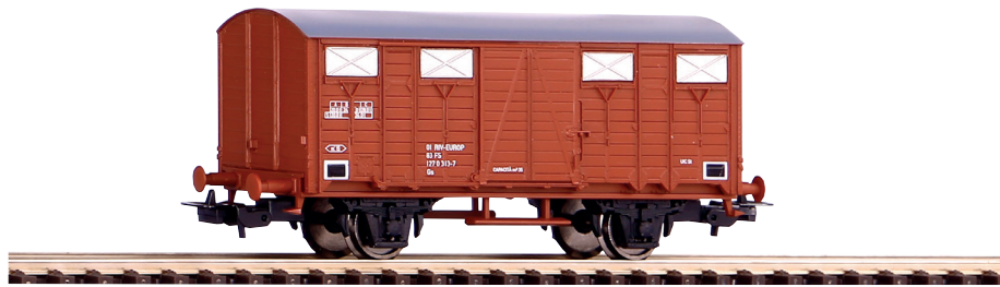
58911 Gedeckter Güterwagen FS Ep. IV