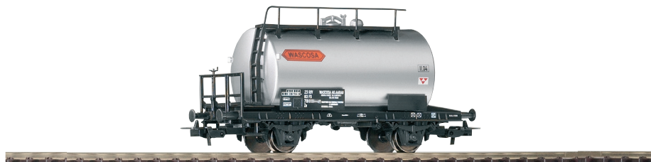
58777 Kesselwagen Wascosa Ep. IV