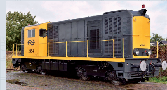
40422 Diesellocc NS 2400 grijs/geel, zwaailichten, periode IV