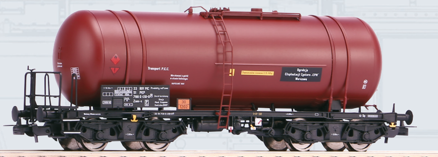
54850 Cysterna PKP Zaes-x (typ 406R), ep. IV 219 PLN

Zbiornik może być napełniany przez wlew górny lub dolny zawór. Rozładunek następuje przez zawór denny lub zawory boczne, rawitacyjnie, bądź przy pomocy pompy. Dostosowane do prędkości maksymalnej 100 km/h wagony typu 406R w trakcie swojej długoletniej służby były poddawane licznym modernizacjom. Cysterny z rodziny 406R do dnia dzisiejszego można spotkać w składach pociągów towarowych na polskich szlakach.