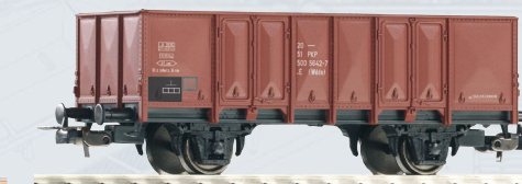
58760 Węglarka Wddo PKP, ep. IV 57,90 PLN