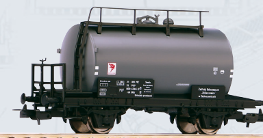
58753 Cysterna dwuosiowa PKP, ep. IV 79,90 PLN