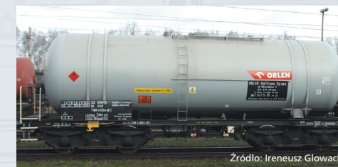
54851 Cysterna PKP Zas (typ 406R), ORLEN, ep. V