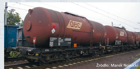
58361 Zestaw 3 cystern PKP Zas (406R), DEC, ep. VI

Uniwersalność opracowania miniatury wagonu rodziny 406R przez firmę PIKO potwierdzają zapowiadane na 2018 rok kolejne modele tych cystern: - #58361 Zestaw trzech wagonów typu 406Rb, właściciel GATX, epoka VI - #58451 Wagon cysterna typu 406Ra, właściciel ORLEN Koltrans, epoka Vc.