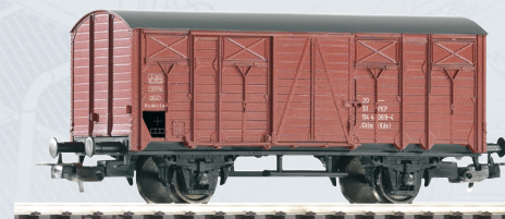
58762 Wagon towarowy kryty Gklm PKP, ep. IV 79,90 PLN